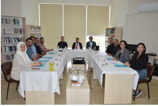
GAZİPAŞA HAVACILIK VE UZAY BİLİMLERİ FAKÜLTESİ 03 Kasım, 2025